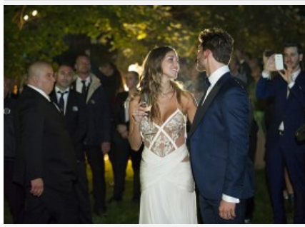
al sito di Gecom, il personale di sicurezza fornito al matrimonio di Belen